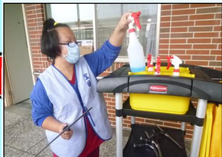
1、配戴口罩，備妥清潔工具。