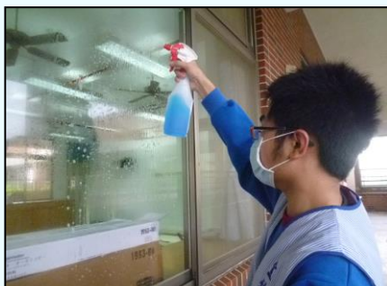
2、S 型噴適量的清潔劑。