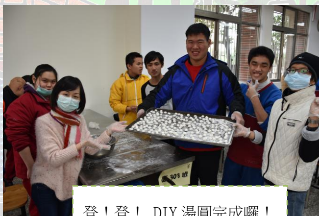
登！登！ DIY 湯圓完成囉！