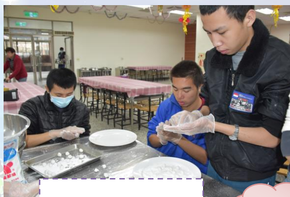
將糯米團搓成圓形