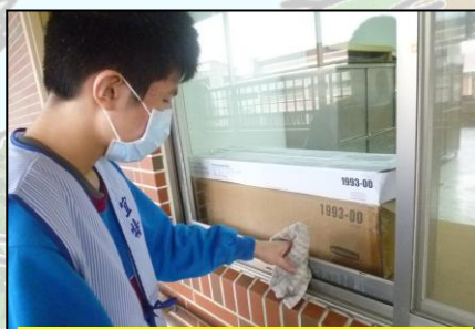
5、擦乾玻璃框緣的清潔劑