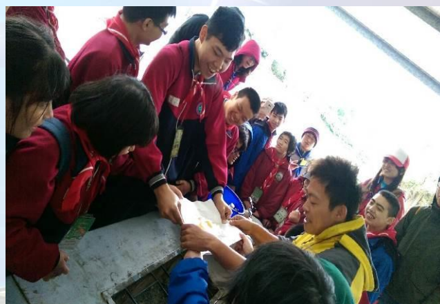
好戲登場~跌倒的漏網鏡頭