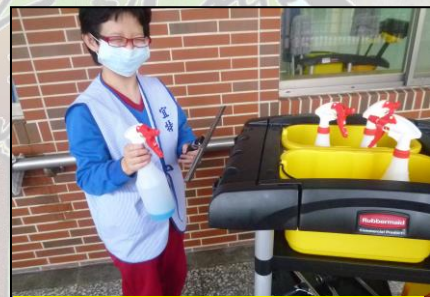
6、收拾並歸位清潔工具。