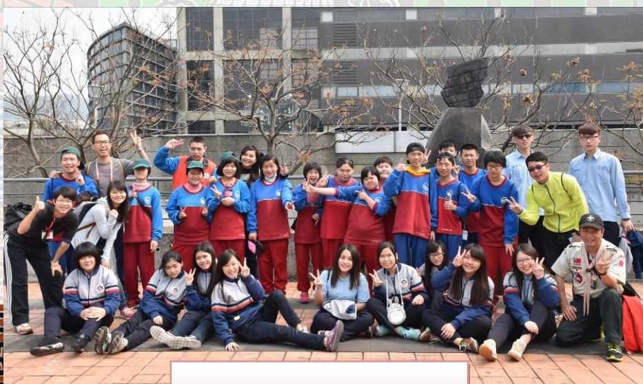
宜特與宜商快樂相見歡