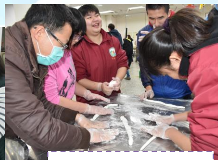
將糯米團搓成長條狀