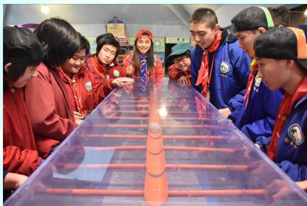
童軍活動學習團結合作