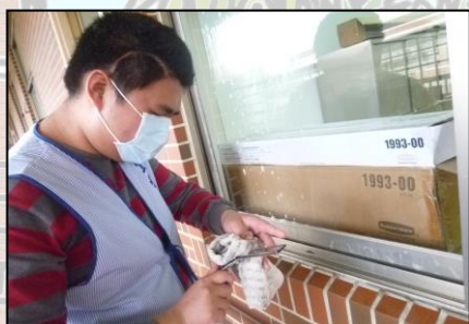
4、擦除刮刀上的清潔劑。