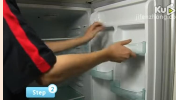
Step2：小心取出隔架，門板置瓶