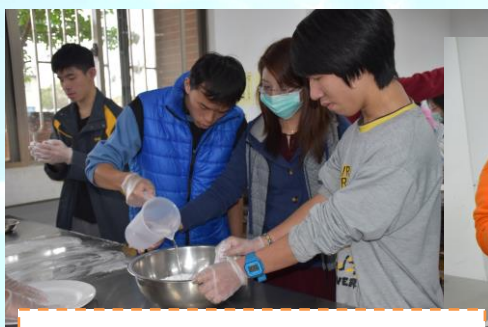
將糯米粉倒入後慢慢加水攪拌

元宵節過完也代表農曆新年的圓滿結束，所以在這天一定要吃湯圓，來看看大家動手搓湯圓認真的樣子吧~~