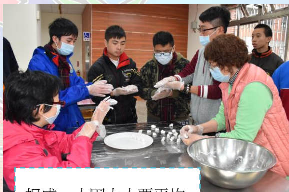
捏成一小團大小要平均