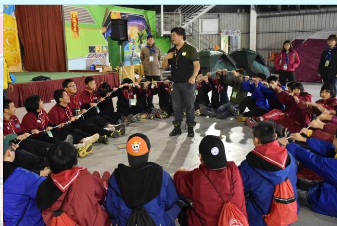
營火晚會~發揮團隊精神