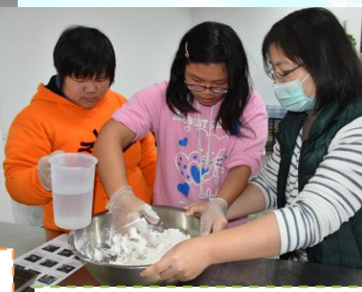
戴上手套後開始攪拌糯米團