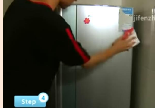
Step4：使用柔軟布、冷洗潔精，擦拭外殼、拉手瓶