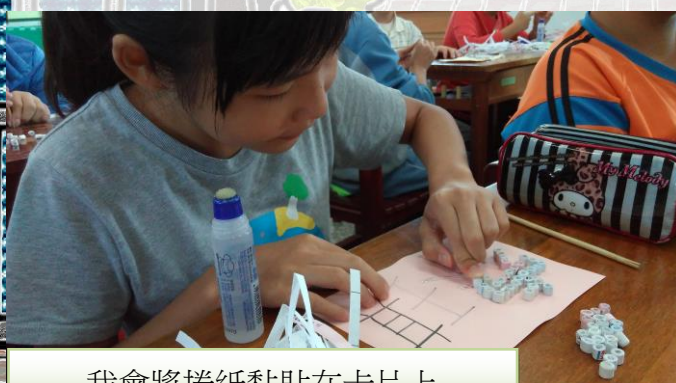
我會將捲紙黏貼在卡片上