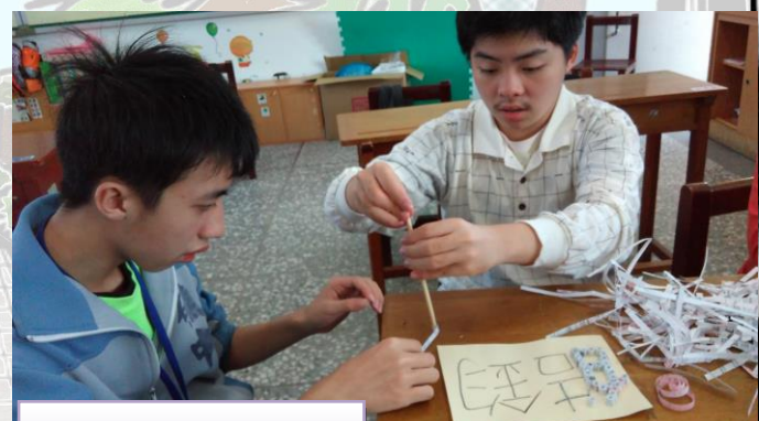
我會幫助同學捲紙