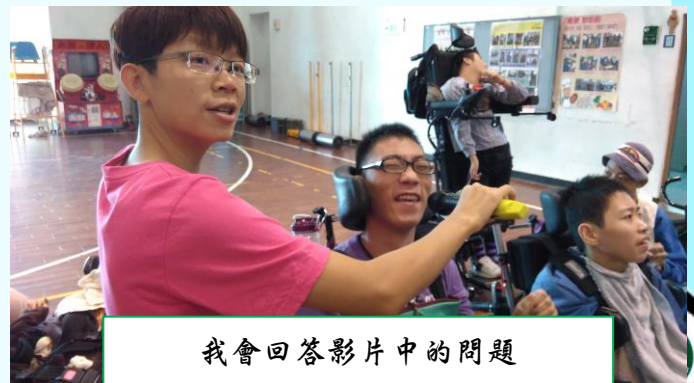
我會回答影片中的問題