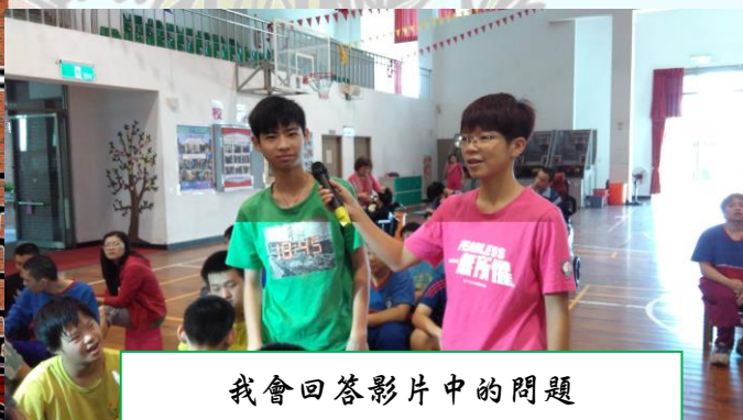
我會回答影片中的問題