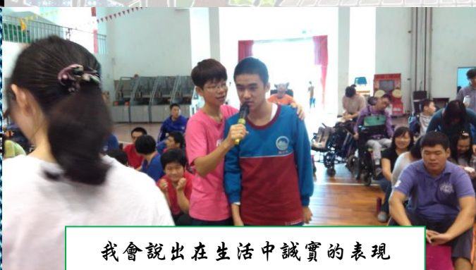
我會說出在生活中誠實的表現