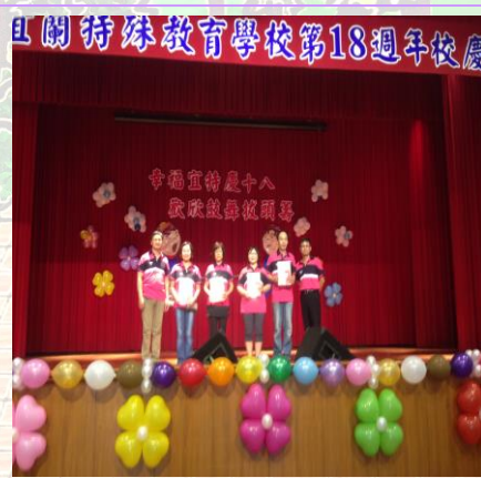
服務滿 10 年