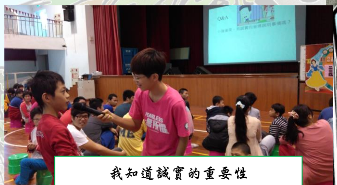
我知道誠實的重要性