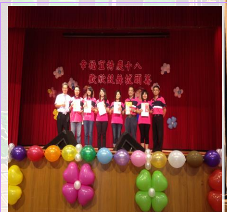
服務滿 5 年