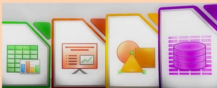
Writer 文件 Impress 簡報 Draw 繪圖 Base 資料

◆在 2010 年誕生的 LibreOffice 有不同時程的版本，例如 3.x 版本是淬煉程式碼，4.x 版本則是強化回應速度，5.x 主要的改善則在使用者介面，讓操作更聰明也更容易使用。估計目前全球約有 8000 萬的使用者部署 LibreOffice，其中有歐洲與南美的大型組織。LibreOffice 5.0，這是一個開放原始碼的辦公室軟體，支援 64 位元的 Windows 平台，相容於微軟最新推出的 Windows 10 作業系統，與微軟 Office 有互動能力，新增對 64 位元 Windows 版本的支援。LibreOffice 內含 Writer 文字處理器、Calc 試算程式、Impress 簡報程式、Draw 繪圖程式、Math 公式程式，以及 Base 資料庫管理程式。