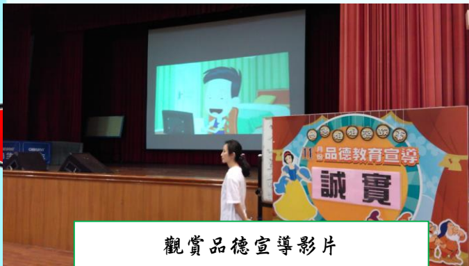
觀賞品德宣導影片

藉由品德宣導活動以及讓孩子提問，加深誠實的重要性，並且在生活中學習待人處事的道理，讓好美德從每一位孩子的身上，都能看的見。