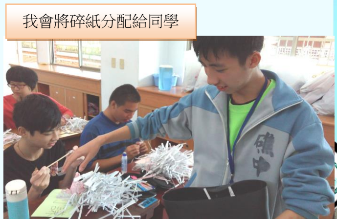
我會將碎紙分配給同學