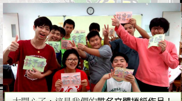
太開心了，這是我們的姓名立體捲紙作品！