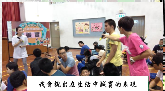
我會說出在生活中誠實的表現