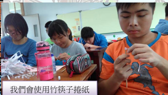
我們會使用竹筷子捲紙