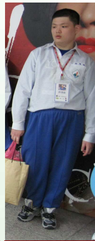
漏網鏡頭下， 因整天步行新鞋咬腳的鬱卒