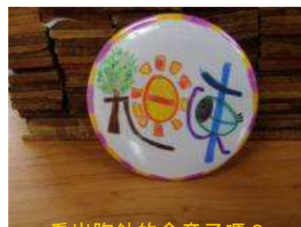
看出胸針的含意了嗎？

• 小時候的我興趣很多，拉二胡、背唐詩都難不倒我，不過因為一場大病，使我沒有辦法自己吃飯（鼻胃管灌食）、說話、走路，因此常常很沮喪，不過幸運的是爸媽、老師、同學都很照顧我，我也很努力的盡我的所能，希望讓自己有所進步，有機會的話希望可以和大家互動一下喔！