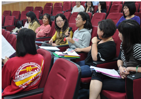
老師們進行減敏感練習