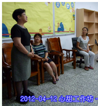
2012-04-12 心甜工作坊 -