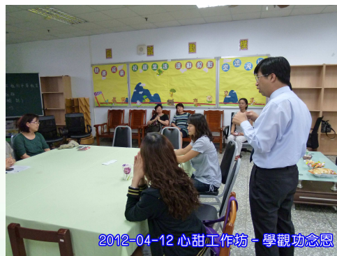
2012-04-12 心甜工作坊 - 學觀功念恩