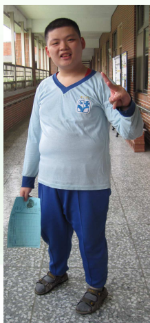
改造前， 許式堅持的穿