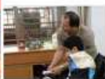
這樣的協助 - 我也會努力

• 小時候的我興趣很多，拉二胡、背唐詩都難不倒我，不過因為一場大病，使我沒有辦法自己吃飯（鼻胃管灌食）、說話、走路，因此常常很沮喪，不過幸運的是爸媽、老師、同學都很照顧我，我也很努力的盡我的所能，希望讓自己有所進步，有機會的話希望可以和大家互動一下喔！