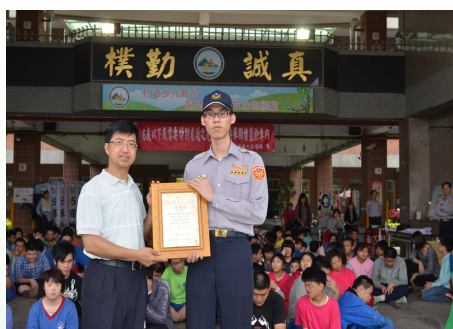
感謝國道公路警察局第九分隊不辭辛勞，蒞校進行宣導。

平日同學們對於警車和用具只可遠觀，難得有這一次的機會，當然要好好把握，認真的體驗。相信經過本次探索活動，日後在搭乘車子上高速公路前，會提醒爸媽喝酒不可以開車，不可以超速，也會更加重視乘車安全。