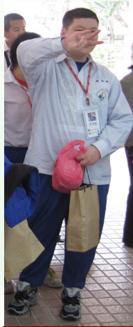
改造後， 整套的制服與新布鞋，開心！