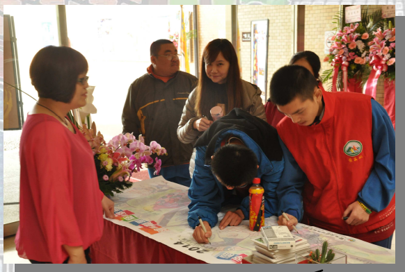
學生到場參觀簽名