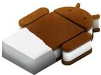
Android 4.0 Ice Cream Sandwich

手機作業系統從早期的各家爭艷，到現今三大系統鼎立的三國時代： Windows Phone 系列 、 iPhone(iOS 作業系統) 、 Android 系統 。