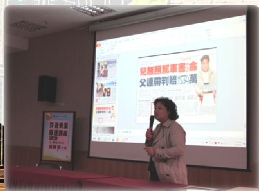
▲蕭小姐以實例向同學說明無照駕駛的後果