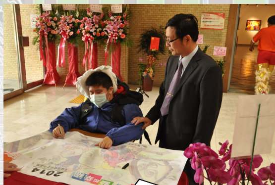
奕煒開心的在海報上簽名