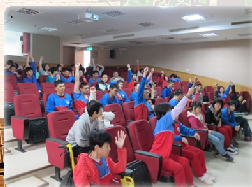
▲同學踴躍回答交安問題