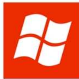
Windows Phone 7.5