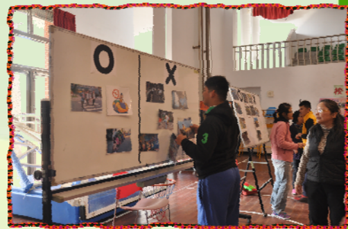
▲大家來找碴-我知道正確的交通安全好行為