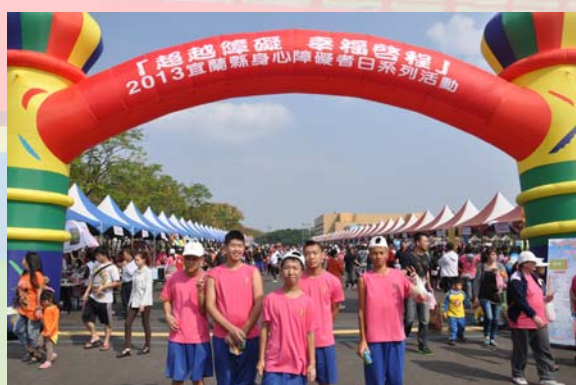
我會自己買東西啫