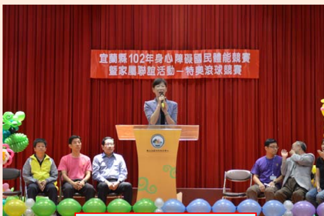
縣長夫人開幕致詞