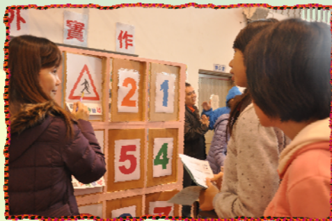
▲交通標誌實果樂-我會指認標誌並連成一線