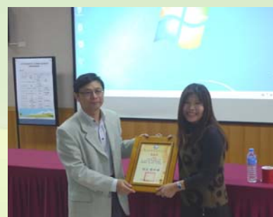
感謝曹小姐的分享