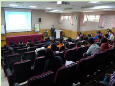
黃總經理強調要有良好的工作態度