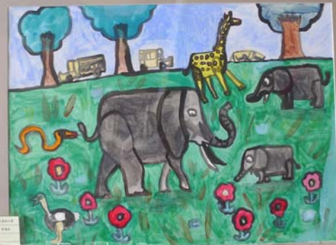
西畫『野生動物園』作者：藍仁偉