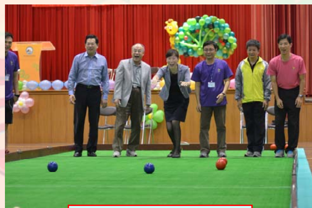
縣政府長官開球儀式