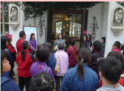
黃副理的熱情接待與解說

藉由本次的活動，讓參與的學生、家長及老師能更了解學生實習及就業將會面臨的事情，並透過家長與雇主直接的互動，使大家都能了解彼此的需求，提升學生在實習及就業安置上的助力。