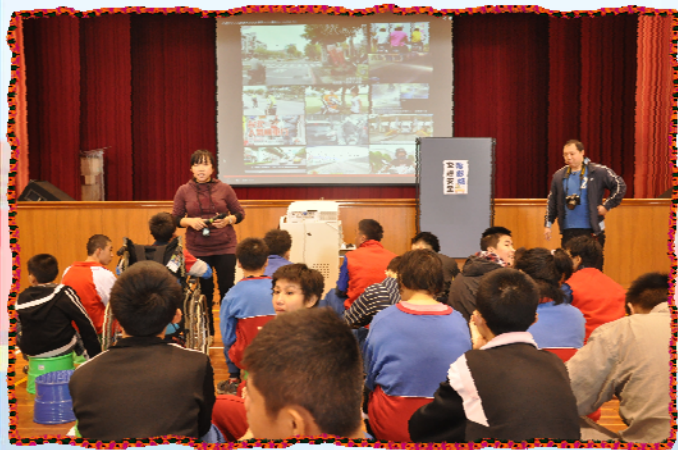
▲交安宣導短片-我知道騎乘機車要戴安全帽