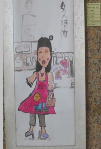
水墨畫畫『女人購物』 作者：蔡承諭