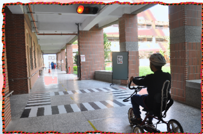
▲腳踏車達人-我會遵守交通號誌