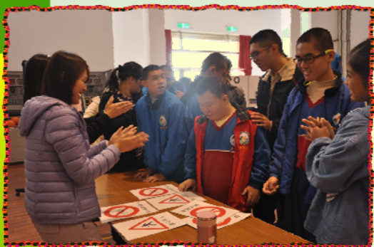
▲交通標誌配對樂-我會找出相同的交通標誌圖片