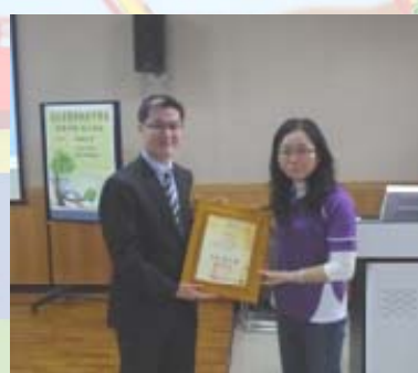
感謝黃總經理的分享