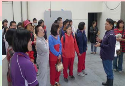
陳課長說明同學實習的狀況 幸福 20 號農場有就業的學長