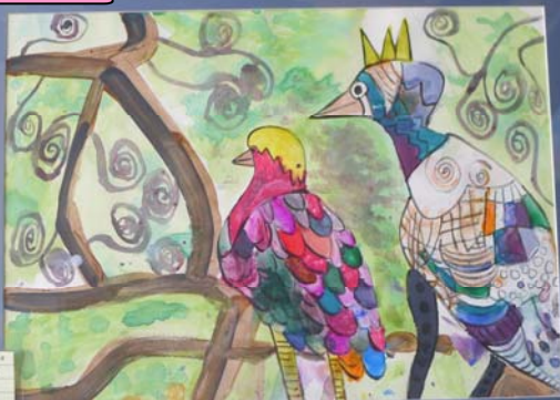
西畫『陪伴』作者：何宗挺