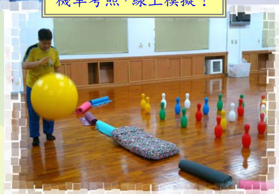
生活休閒，運動一下！