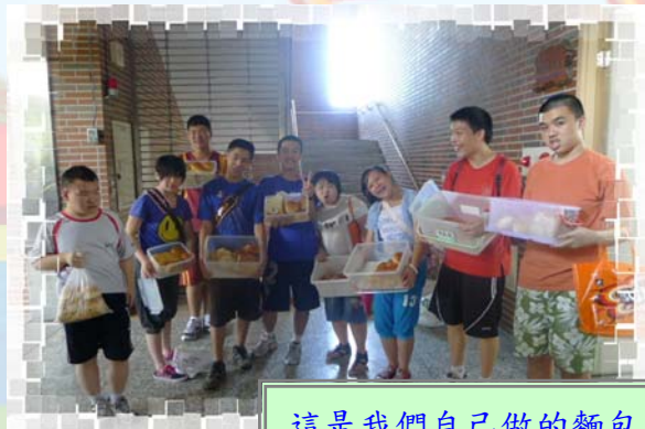
這是我們自己做的麵包， 與大家一起分享！