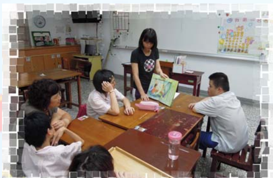
就學輔導：理財繪本～同學認真參與