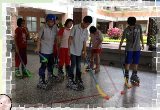
體適能：直排輪與曲棍球，好好