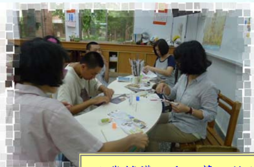
就業輔導：手工藝～捲紙達人