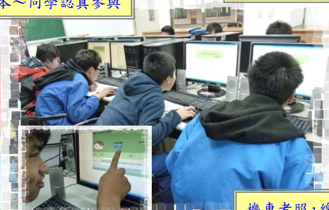
機車考照，線上模擬！