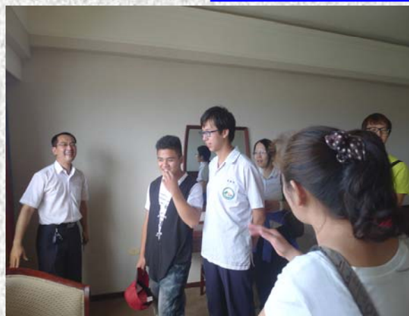
至利豐食品進行媒合

因此，要讓孩子在畢業前能順利就業，從一開始就要培養他們負責任、守規矩的態度，其實這些生活態度，在高一時便可以開始加強訓練，讓他們靜下心來完成交付的班級事務工作，成為老師可以信賴的小幫手；還有，在家庭方面也要訓練孩子學會家庭事務的分擔，久而久之讓他們養成責任心，所以，生活態度的養成要儘早開始，若學校老師及家長雙方能攜手合作，則未來孩子們穩定就業應該不難。