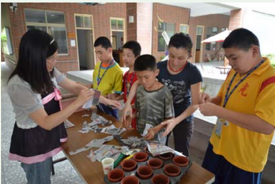
開學典禮，大家一起播下幸福種子

但接下來的時間宜特師長也都沒閒著：新生能力評估之後，教師助理同仁們分組做家訪，從頭城大里到蘇澳全縣走透透，希望能深入學生的家庭生活，了解孩子的親子互動，資源支援系統，和最重要的特別需求。詳實的家訪資料，讓教學和專業團隊能評估特教和復健專業服務的需求，必要時專業團隊也再進行到府評估的工作，更精確的設計個別化復健服務方案。8 月份確認教師編組後，導師開始為 IEP 前置作業，包括轉銜資料消化、家訪、輔導組的適性轉銜會議召開等。一直到 8 月中旬，宜特師長提前收假，到校召開 IEP，更為了配合家長和部份進修同仁的時間，更利用到週六的時間。所有的預備動作，都為了更提供更周全適性的特教服務而做。