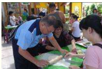
同心協力，團隊合作 DIY。