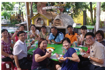
將幸福帶回宜特與大家分享。校長到場勉勵大家共同合作。