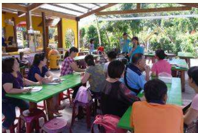
農場主人馨誼細細分享如打造幸福環境。