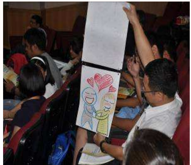
分組實作-繪本說故事