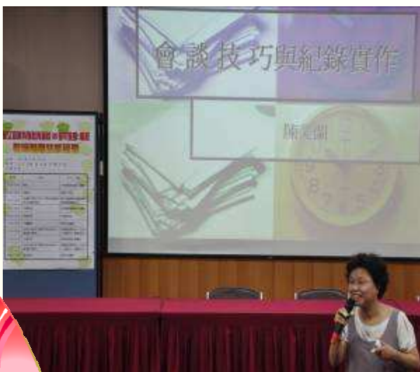
會談技巧及紀錄實作