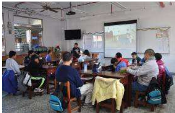
班級進行性別平等教育宣導