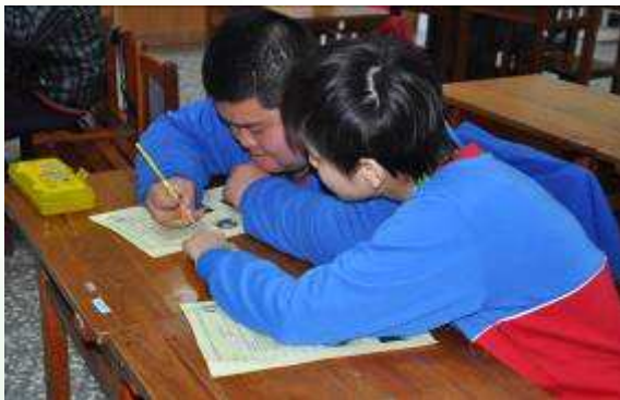
學生認真填寫性別平等教育學習單