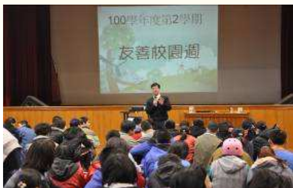
校長向師生宣導友善校園週之意義

2月8日至2月14日為本校友善校園週，透過例行性的反霸凌、性別平等教育等活動辦理，增進學生正向人際互動，降低學生霸凌、性騷擾或性侵害事件之發生，讓學生了解遇到校園性侵害或性騷擾事件之申訴管道，積極營造友善校園環境。活動內容包含校長向全體師生說明友善校園之意義、反霸凌宣導及宣誓、性別平等教育宣導等。