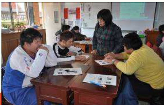
班級進行性別平等教育宣導及討論