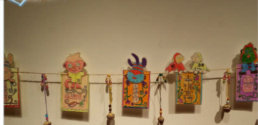
立體書卡、檳榔種子