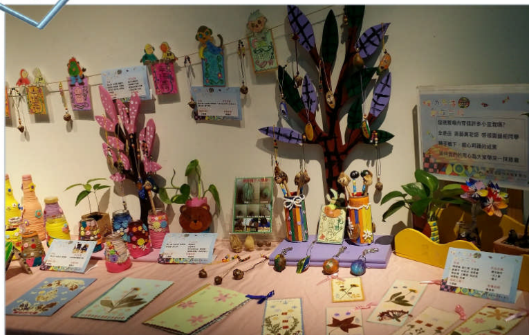
葉拓手工書、種子吊飾大集合