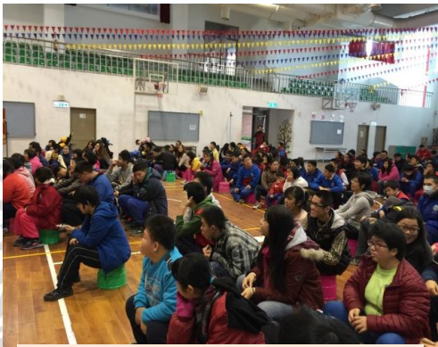
同們們聆聽金德老師講演

寬恕對自己而言，也是一門必修的學分，看見別人的優點，學會原諒別人，包容別人，存好心說好話，能夠接受別人的意見；對於別人的批評指教，要適時地反省，接納每個意見與聲音，把「原諒別人」、「讚美別人」、「接受別人」時常謹記在心，相信未來的生活一定可以更美好，共勉之。