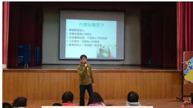
寬恕的五個中心目的