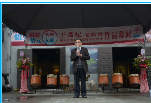
校長致詞-感謝各界提供的協助！