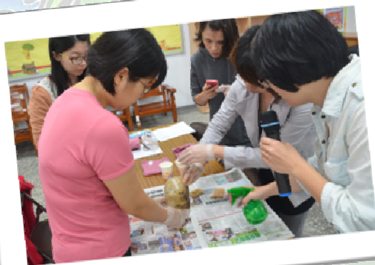
實作體驗感受魔法師對油膩膩的魔力