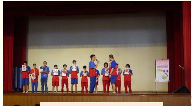
特教孩子也有無限的潛能