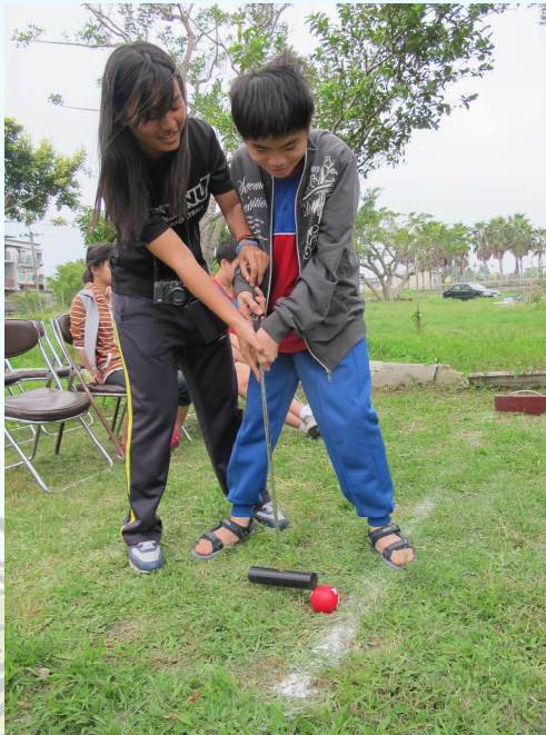
班際體育競賽(1)-槌球大賽

第一次體驗槌球運動，大家玩的很開心，感謝教務處添購槌球組，讓我們又多一項休閒運動。