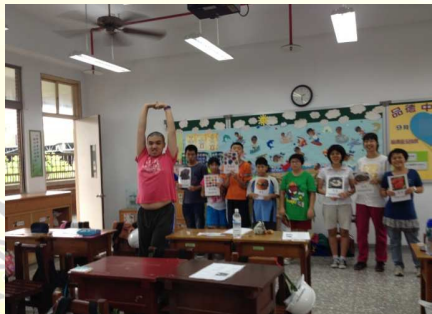
大家公認最可愛的胖國王—宗挺

當老師告訴同學：將以戲劇表演的方式來和全校師生分享這本繪本故事時，班上的每個同學都樂不可支，開心的手舞足蹈，期待這一天的到來。雖然練習的時間有限，但是大家都能熟讀胖國王的劇本，把握每周排演的短暫時光，體會另類語文課學習的樂趣，看著大家的認真與熱情，聽著大家琅琅上口的台詞與笑聲，老師也樂在其中。