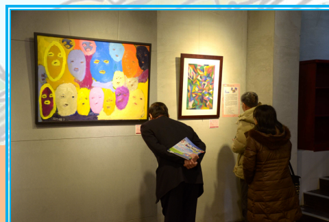
參觀的來賓很仔細的觀賞學生作品！