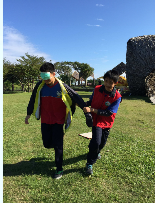
班際體育競賽(3)-視障體驗趣味競賽

第一次體驗槌球運動，大家玩的很開心，感謝教務處添購槌球組，讓我們又多一項休閒運動。