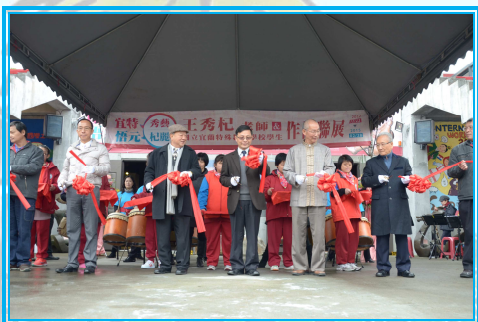
貴賓蒞臨剪綵，為開幕式揭開序幕！