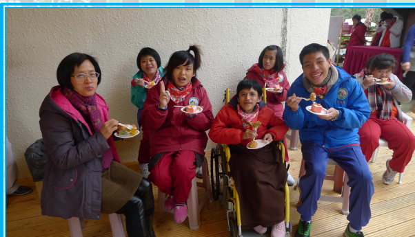
悟饕飯包提供精美的茶點，學生們開心的品嚐餐點！