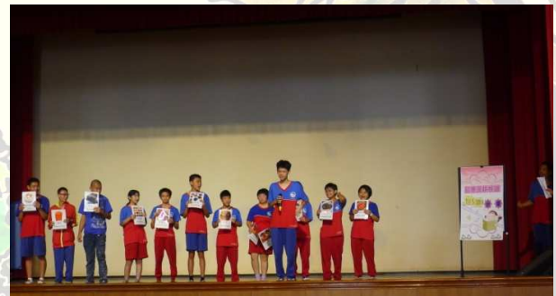
最帥的瘦國王—勝邦出場，獲得大家如雷的掌聲

一直相信特教孩子也有無限的潛能，在戲劇排演的過程中，和孩子們討論每個角色、每句台詞該如何表現？大家都能踴躍發表意見，說出自己的想法，很多可愛的巧思為排演中的我們增添不少歡樂的笑聲，享受著孩子們的快樂，真的是一種教學上的幸福！