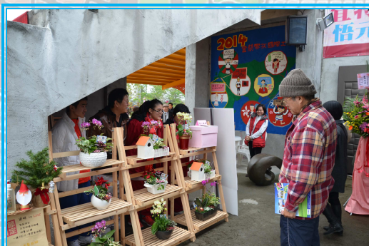
參觀來賓對於學生的組合盆栽作品，讚賞不已！