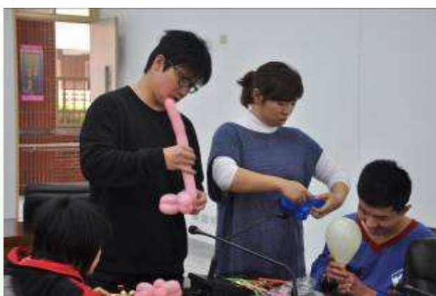
專注的眼神，認真的練習