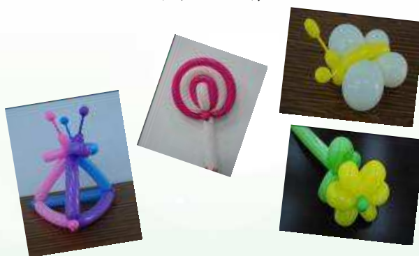
給我們的作品按個”讚”！