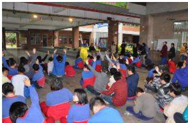
有做到負責任行為的同學請舉手， 大家幾 都舉手了。