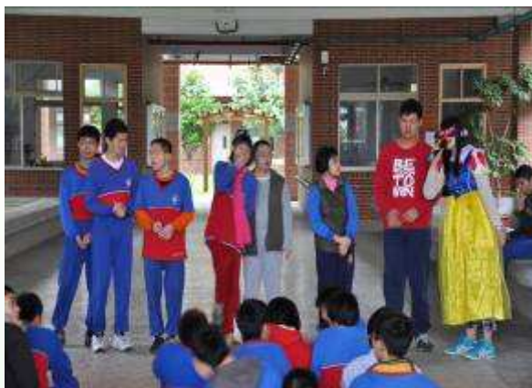
學生們 上台前， 和大家分享自己負責任的行為。

過程雖然辛苦，但靠自己的 力，做到了負責任，是各位同學可以學習的好 樣，希望大家也都可以學習為自己所做的事負起責任，當一個有責任感的好小孩好學生 !!