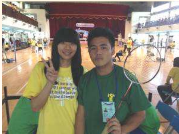
與嘉義大學志工姐姐合影