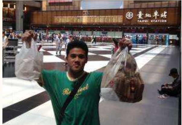
在台北車站買午餐