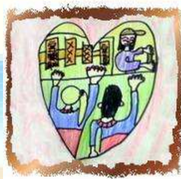
哥哥姐姐解說宜蘭餅

到達宜蘭餅發明館，我們要做牛舌餅DIY之前，要洗手，還要聽哥哥姐姐的解說，這樣宜蘭餅才會做出來很衛生又很好吃，我第一次做宜蘭餅的經驗是把宜蘭餅做得又長又短，我覺得宜蘭餅好吃就好，做好宜蘭餅之後，再來看叔叔阿姨她們賣力的