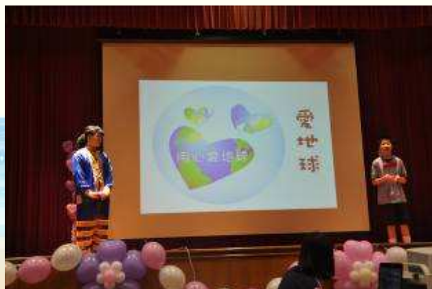
愛地球，從我做起戲劇表演