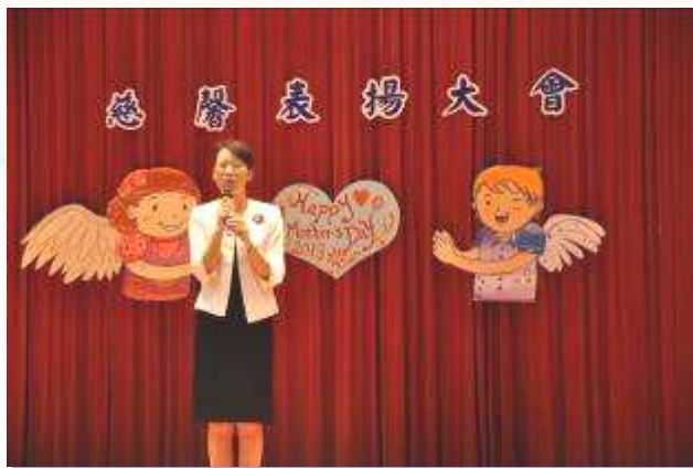
每年都會到校勉勵大家的縣長夫人

每年到五月，校內便會進行一連串的生命教育活動，除了教導學生珍惜生命，愛護萬物外，也要學習感恩父母、感恩家人，當中最重要的活動便是慈馨表揚大會，父母是孩子成長過程中最重要的推手，也是最辛苦的，當然也有許多學生是由祖父母帶大的，為感恩家長一路上照顧孩子的辛勞，也藉此機會讓學生表達對父母的養育恩情，整個活動在溫馨、感恩的氣氛中圓滿結束。