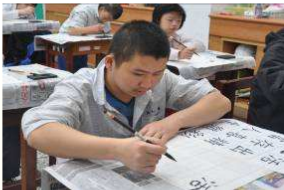
專注地完成每一筆劃