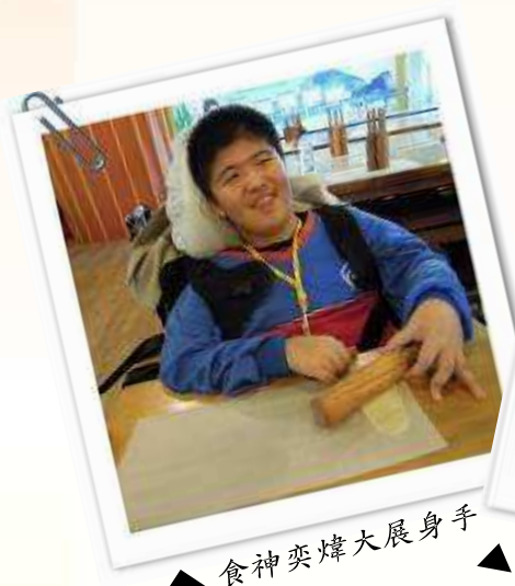
▲ 食神奕煒大展身手

參觀完利澤焚化廠後，接下來就要進行宜蘭著名觀光工廠之旅囉，首先在宜蘭餅發明館自己 DIY 製作超薄牛舌餅，還有參觀超薄牛舌餅的製作過程，以及試吃好吃的牛舌餅。另外，在博士鴨觀光工廠，不但有美味的鴨肉便當，還有進行創意十足的彩繪胖鴨撲滿，同學們將鴨撲滿塗的非常有個人風格，展現驚人的繪畫創意。這次的校外教學，不僅是具有環境教育的意義，也讓學生們對宜蘭的觀光產業有更深層的了解，希望同學們再接再勵，繼續日行一善、早晚問安、行三好，持續累積福田卡的點數，不但可以獲得下一個階段的獎勵，還可以讓自己變成一個有品的宜特好學生喔！