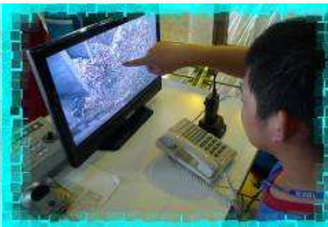
▲天啊!!垃圾也太多了吧!