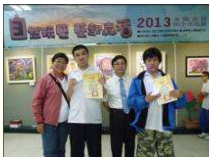
與宜特大家長合影

當然在宜特不僅有課業上的學習，更朝著「建立美好品格」「欣賞接納自己」、「努力做到最好」的目標前進。每當看見宜特孩子的笑臉，那是被鼓勵、讚美、肯定、充滿自信、真誠的笑臉。因這裏有全心付出愛；認真教學的校長與老師們、辛苦的叔叔阿姨們，有親愛的同窗好友們。在友善安全的校園中，宜特有一群宜蘭最最幸福，努力活在當下，值得讚賞的孩子們！