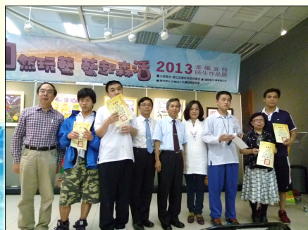
作品聯展開幕合照