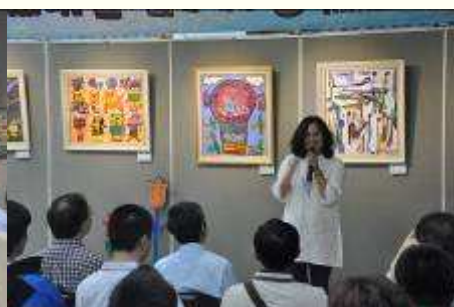
學校家長會長蒞臨鼓勵