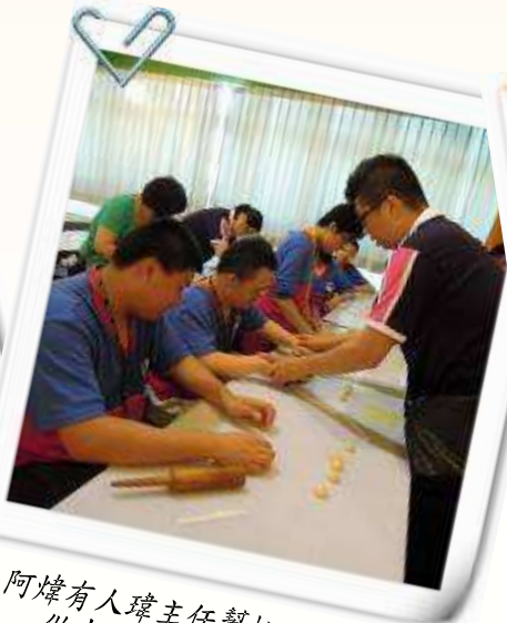
▲ 阿煒有人瑋主任幫忙，有如神助，做出 0.01 公分的牛舌餅唷！