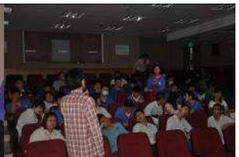
認識勞工處能提供的就業相關服務