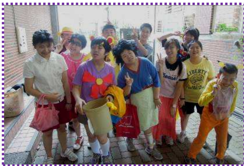
卡通人物角色都是學生們自己選的唷！

從我做起 愛地球 做好 回收 不亂丟 隨手關燈 關電源 使用 環保 杯筷袋 鐵馬 步行 兼保健 大家都要 愛地球