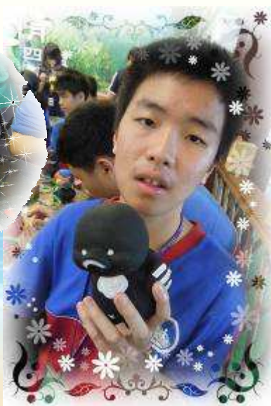
▲ 嗯~~這是企鵝還是黑白郎君鴨？