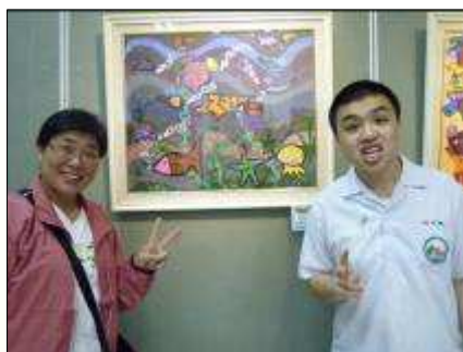
感動時分滿心歡喜