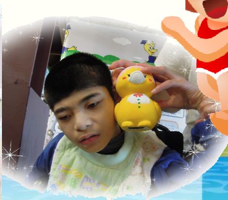
▲ 這是傳說中的黃色小鴨嗎？