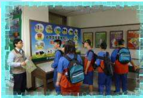
▲專業的解說員向同學介紹資源回收物品的種類!

學生們每天落實有品 123 運動，認真努力進行福田卡集點，第一階段的獎勵品已經出爐囉-參加利澤焚化廠、宜蘭餅發明館及博士鴨觀光工廠。經由班級導師的推薦後，有 66 位學生可以獲得校外教學的門票，前往位於五結利澤簡的利澤焚化廠，除了少部分同學有去過焚化廠外，很多同學都是第一次參觀焚化廠，這改變了許多人對焚化廠的刻板印象，如又臭、又髒等，而是看到的是最先進的儀器及設備，同學們在廠內專業導覽人員的介紹下，不僅看到了精密的儀器設備外，還學習了資源回收的分類、環保標章的辨認等。