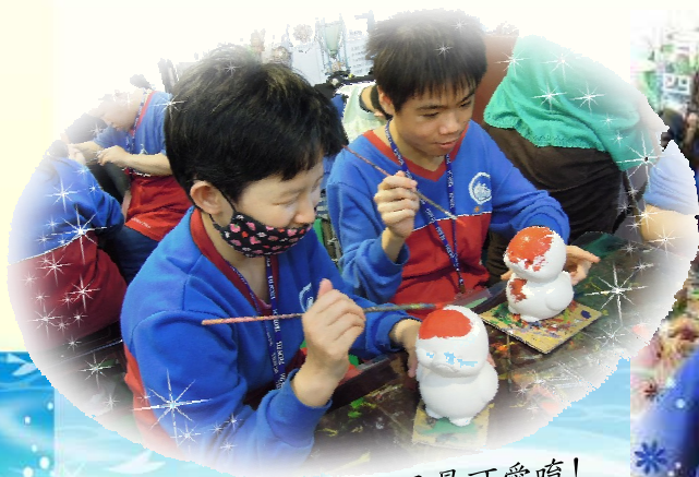
▲ 專心做畫的孩子最可愛唷！