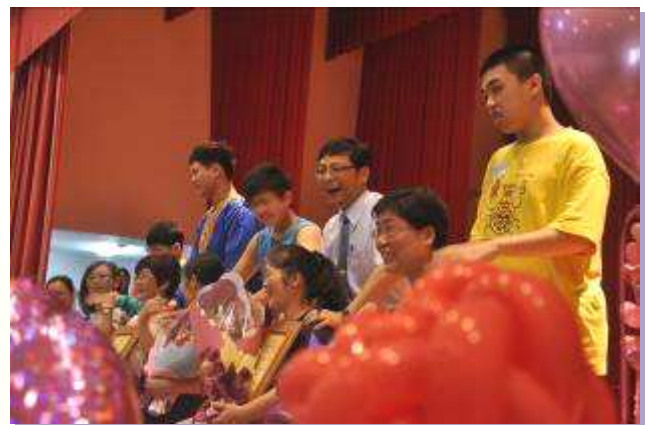
幫媽媽按摩，感謝媽媽平常的辛勞