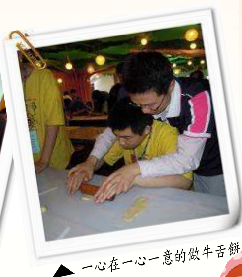
▲ 一心在一心一意的做牛舌餅