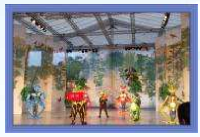
蛙靠部落的變種蛙，發生..