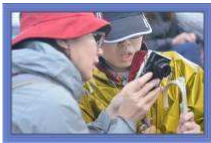
小文妳看相機裡有誰..