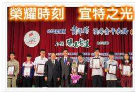
青年節 優秀青年表揚