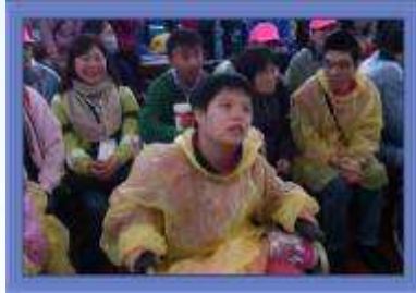
認真看表演的柔柔！