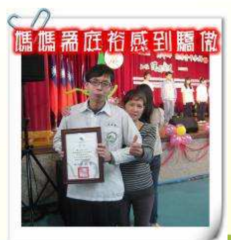
媽媽庭裕感到驕傲