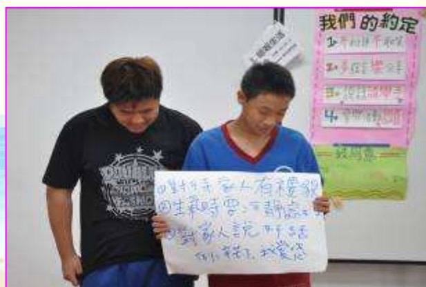
子豪及家宏分享增進家庭關係