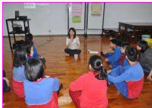
佳惠老師分享自己的婚姻及家庭生活經驗

活動一開始佳惠老師先介紹自己的原生家庭，然後再分享自己透過婚姻組成另一個小家庭，進而因婚姻而成為另一個家庭的成員角色，經由成長的歷程，慢慢增加家庭成員，得到的家人關懷變多，自己也慢慢的肩負多重角色(孩子、姐姐、媽媽、媳婦、太太、孫女等)。