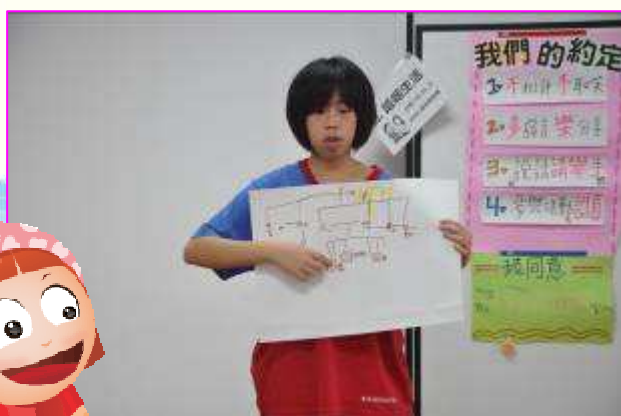
欣怡分享自己的家庭樹