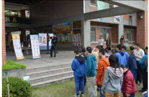
聽課感覺：「蠻新鮮的」