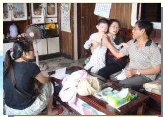
小文平時由祖父、祖母照顧