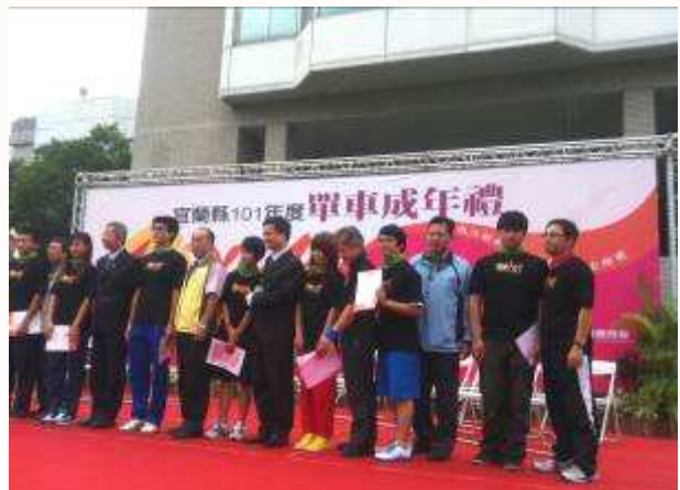
和宜蘭縣高中職校長及同學合照