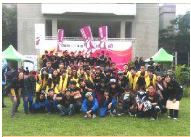
完成成年禮儀式囉，大合照~