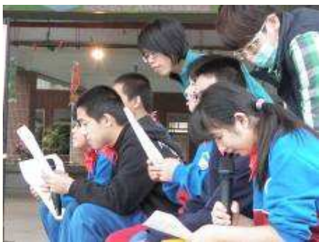
導讀同學認真盯著劇本，就怕不小心錯過一句台詞。