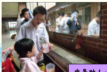
我是助人小幫手喔