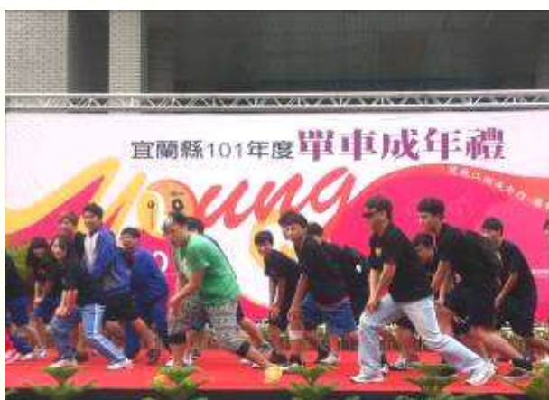
猛將阿榮和宜中同學大跳騎馬舞