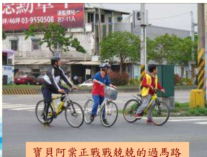
寶貝阿棠正戰戰兢兢的過馬路