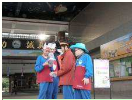
故事主角阿比與阿寶按照旁白表演出故事中的精彩橋段。