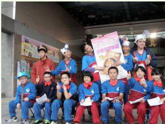
高一悅讀戲劇分享，大成功！！

11月5日朝會活動有點不一樣，高一同學透過導讀及戲劇表演方式，與全校同學分享『一片披薩一塊錢』故事。話說… 會做披薩的大熊阿比和會做蛋糕的鱷魚阿寶是一對要好的鄰居，你請我吃蛋糕，我請你吃披薩，真是快活極了。可是有一天阿比做起發財夢，決定一片披薩要賣一塊錢！這下子，好朋友會不會鬧翻呢？