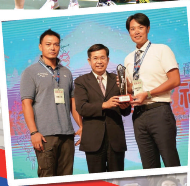
109年度教育部體育署獎勵學校 體育團體績優學校