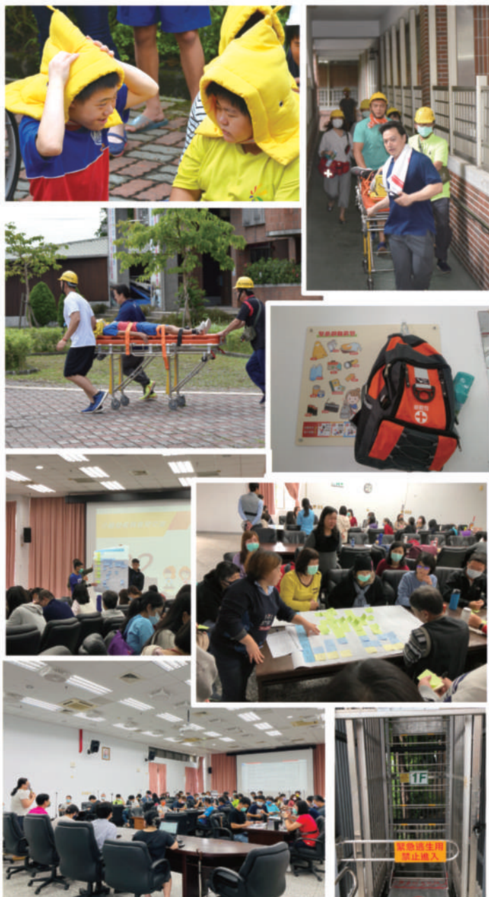
• 防災演練精彩照片

宜特防災校園的建置沒有花麗的包裝，只有務實的演練。我們以『自助、共助、公助』為防災規劃設想。由於災害發生的當下，外援通常無法立即到達，唯有透過不斷訓練讓學生、老師第一時間『自助』知道如何先保障自身安全，然後『共助』相互協助幫忙，在指引下快速地移動至安全集合點，才能充足的時間等待『公助』外援的到來。