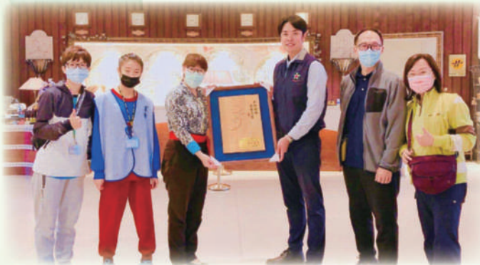
• 109年教育部表揚提供身心障礙學生校外實習及就業愛心楷模廠商

宜蘭地區有許多的友善職場，就像是宜蘭特教學生的聖誕老公公，儘管聖誕老公公隨著時代的變化而慢慢轉變，但在學生的心目中，職場所給予的工作訓練與機會，都像是挹注了許多的希望，讓宜蘭特教的學生能有機會成為社會中百分之一百的工作者。