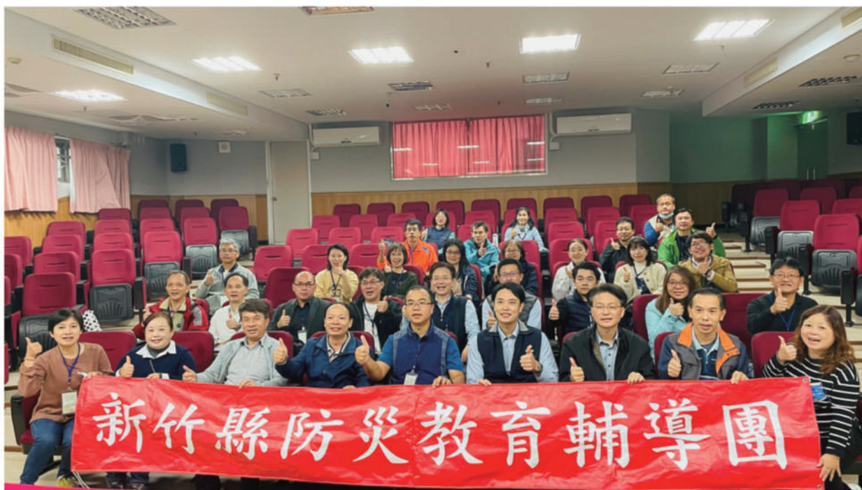
• 1101126新竹防災輔導團參訪

本校位於五結地區，建校多年以來歷經多次颱洪災害，尤其是2010年梅姬風災造成的影響最為激烈，洪水淹沒整個路面，分不清學校與周圍大排、農田與馬路的界線，交通車無法接送學生，造成師生受困校園，好險在大家齊心協力下共同安全度過難關。