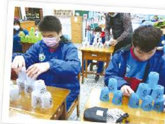
▲ 課扶一健康體適能