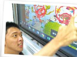
▲ 學扶一生活與休閒