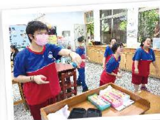
▲ 學扶計畫生活休閒